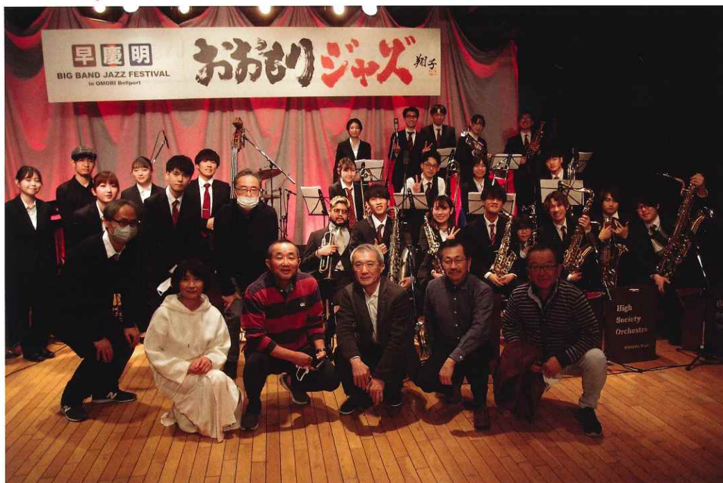
スタジオ収録後に早稲田ハイ・ソサエティ・オーケストラメンバーと早慶明実行委員にて

* → YouTubeにアーカイブされています。「おおもりジャズ」ホームページからご入場ください。 http://3bb-jazz.jp スタート約10分後から演奏をお楽しみ頂けます。